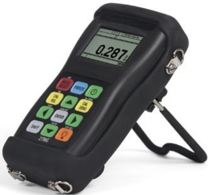
装有可选橡胶保护套的27MG测厚仪，保护套上带有颈挂带和仪器支架

根据您所在地区的不同，标准套件可能会有所不同。 要了解详细情况，请联系您所在地的经销商。