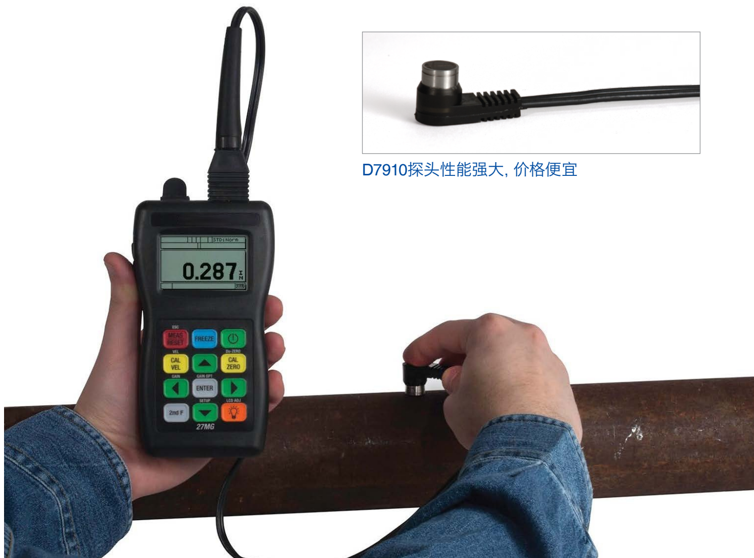
D7910探头性能强大, 价格便宜

27MG测厚仪的标准配置中包含经济实用的D7910双晶探头，用户使用这款探头可以完成很多基本腐蚀应用的测厚操作。Evident 还备有种类齐全的双晶探头系列产品，可以对极薄、极厚的材料，或小直径管件进行测量。与27MG测厚仪兼容的 Evident 探头带有自动探头识别功能，可通过自动调用默认V声程校正的方式，优化探头的性能。