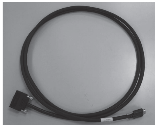
Camera Link ケーブル 2m