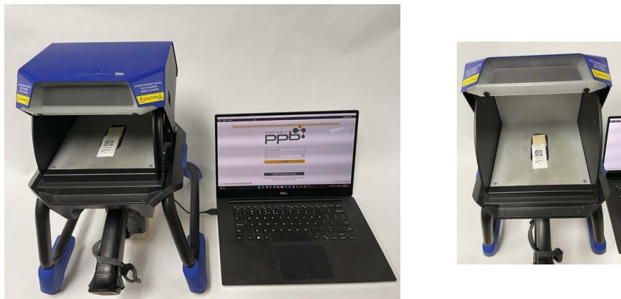
图1: 在Vanta工作站中使用Portable PPB的pLIMS软件对detectORE收集器进行分析。