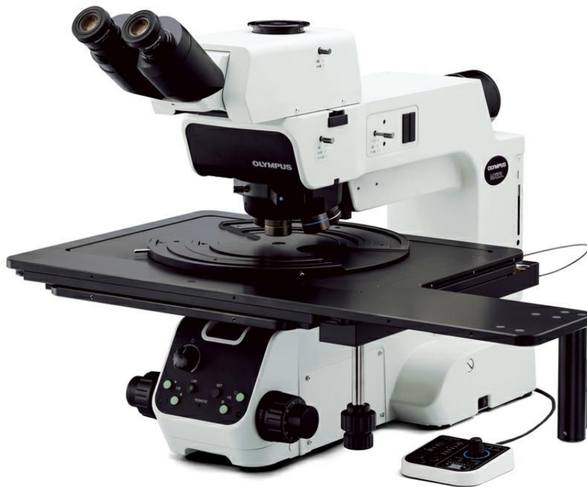
图3. MX系列半导体工业显微镜可用于检查300 mm以下的晶圆。