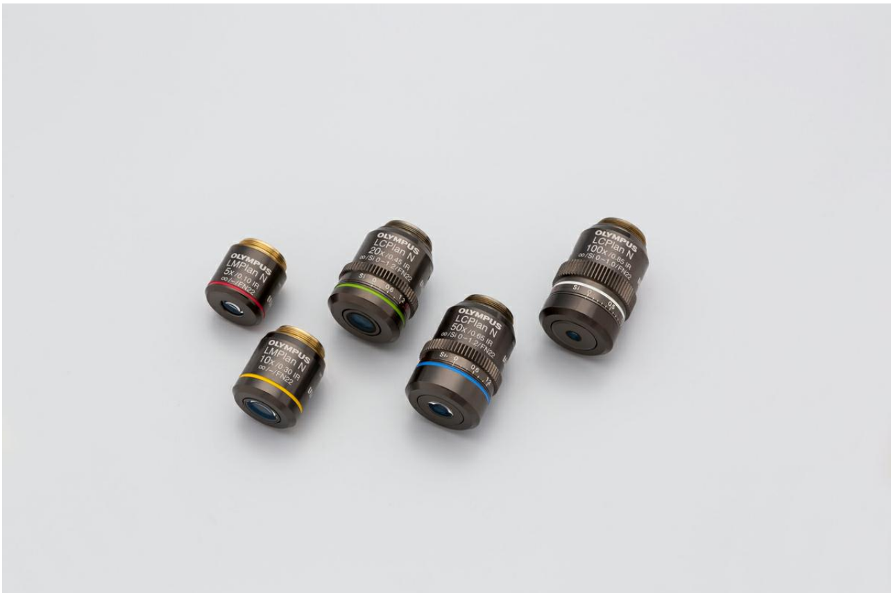
图4. 高质量物镜与MX系列工业显微镜搭配使用，是UV荧光和红外检测的理想选择。