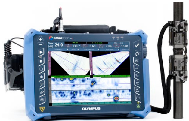
Scanner COBRA installé sur un tuyau (0,84 po) avec deux sondes multiéléments A15, un raccord en Y et un appareil OmniScan MX2 16:64 affichant deux groupes PA.

Cette solution Olympus comprend des sondes multiéléments à profil bas ayant une focalisation d'élévation optimisée, ce qui permet une meilleure détection de petites indications sur les tuyaux à paroi mince. Des sabots à profil bas de conception spéciale s'adaptant à chaque diamètre de tuyau sont offerts pour compléter la solution. Le scanner COBRA garantit une pression stable, constante et puissante qui assure d'excellents signaux ultrasons et un codage précis sur toute la circonférence du tuyau.