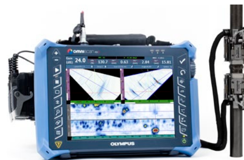
COBRA scanner sobre um tubo de 0,84 pol. com duas sondas PA A15, adaptador em Y e um detector de defeitos OmniScan MX2 16:64 exibindo dois grupos PA.

Essa solução da Olympus utiliza sondas de baixo perfil com focagem de elevação otimizada, o que aumenta a detecção de pequenos defeitos em tubos com paredes finas. Especialmente projetada para calços de baixo perfil que para se ajustar a cada diâmetro do tubo coberto pelo escâner. O COBRA scanner proporciona uma pressão estável, constante e forte, fornecendo, assim, bons sinais de ultrassom (UT) e uma codificação precisa de toda a circunferência do tubo.