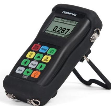
Equipo 27MG con su funda protectora de caucho, una correa para el cuello y su soporte.

El contenido de serie puede variar según su país o región. Contacte con su distribuidor local.