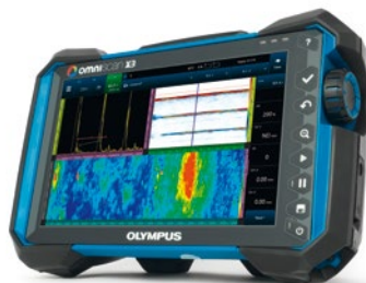
OmniScan X3: Detector de defeitos por Phased Array