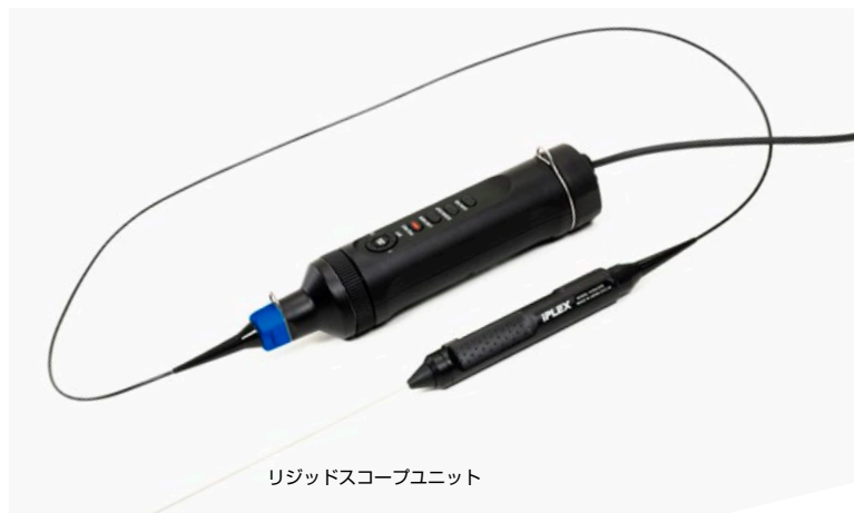
リジッドスコープユニット