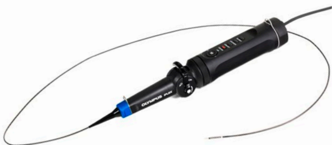
フレキシブルスコープユニット

挿入部内のレンズを通して接眼レンズに画像を伝達する硬性鏡とは異なり、IPLEX TX IIリジッドスコープは、レンズ先端にCMOS イメージングセンサーが搭載されているため、挿入部がわずかに損傷しても、継続して検査画像が得られます。