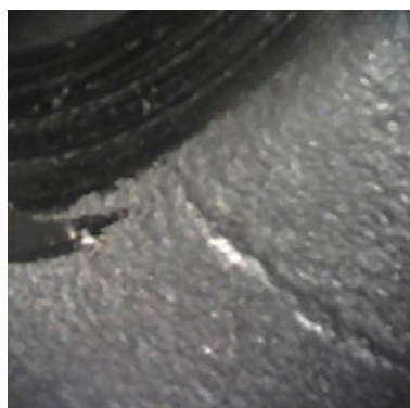
IPLEX TX (従来機種)

IPLEX TX II ビデオスコープは120度の視野角を備え、一度に広い範囲を観察できるため、検査の迅速化に貢献します。さらに、高画素CMOSセンサーの搭載により高画質を提供します。